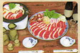
▲しし鍋 (11月1日~2月末まで)